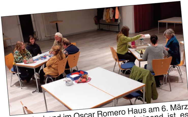
Der Spieleabend im Oscar Romero Haus am 6. März war leider nicht gut besucht. Anscheinend ist es schwer die Menschen aus dem Haus zu locken. Schade für die Organisatoren, die sich die Mühe machen so etwas zu veranstalten.