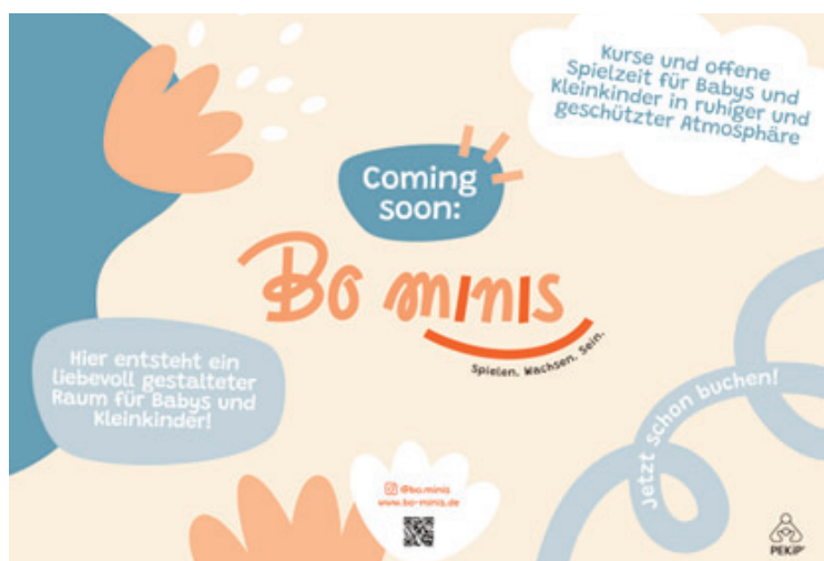
Bo minis – die kleine Welt für große Entwicklung.