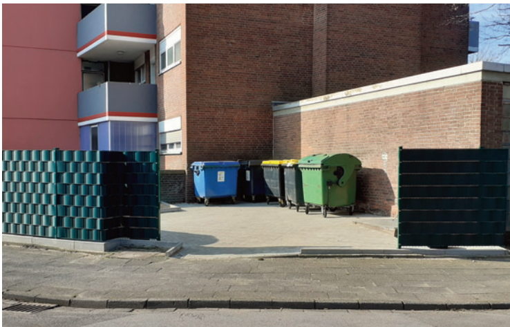
Oderstraße 55 (Foto 1)