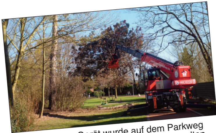
Mit schwerem Gerät wurde auf dem Parkweg neben der Bodelschwingh Schule einem alten Baum zu Leibe gerückt. Holzfällen auf moderne Art.