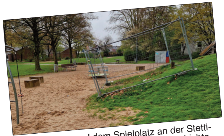
Die Absperrung auf dem Spielplatz an der Stettiner Straße ist ja schon eine längere Geschichte. Man fragt sich, ob das Ding nicht ein wenig überdimensioniert ist. Auf Nachfrage des Bürgervereins beim zuständigen KBK erhielten wir die Antwort, dass die Montage einer neuen Rutsche vorgesehen ist. Leider gibt es nur zur Zeit Schwierigkeiten mit der Lieferung, so dass aktuell nicht absehbar ist, wann genau die neue Rutsche kommen wird.