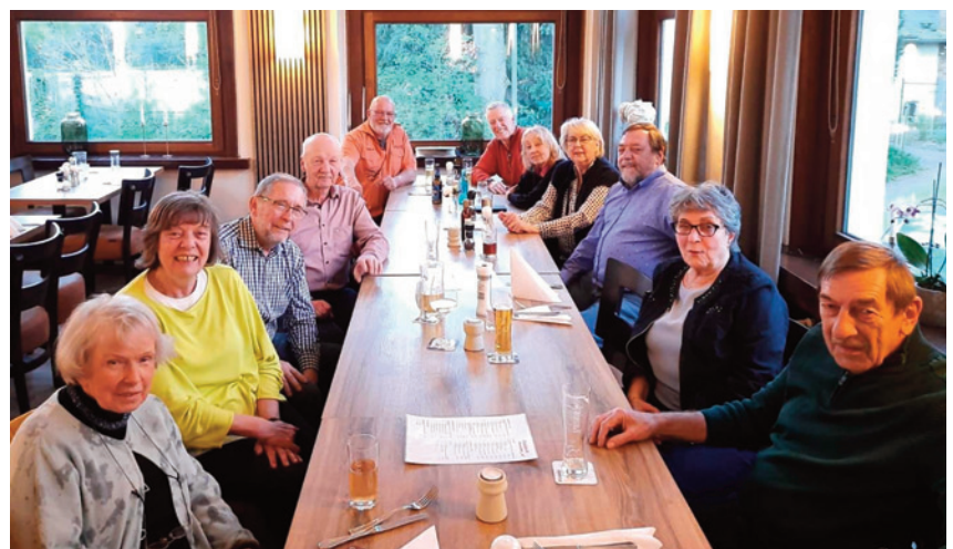
Klassentreffen nach 60 Jahren