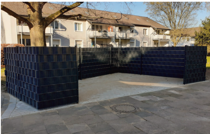
Stettiner Straße (Foto 2)