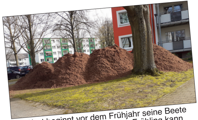
VivaWest beginnt vor dem Frühjahr seine Beete mit neuer Erde aufzufüllen. Der Frühling kann kommen.