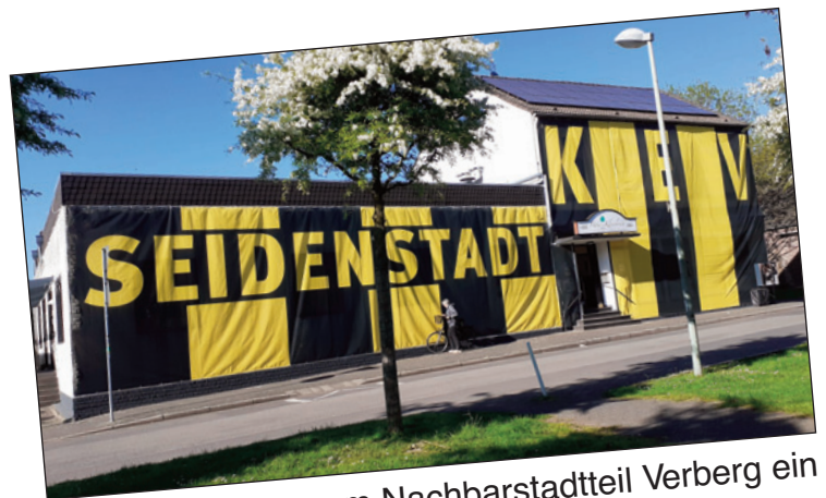
Da ist wohl in unserem Nachbarstadtteil Verberg ein richtiger KEV Fan tätig gewesen.