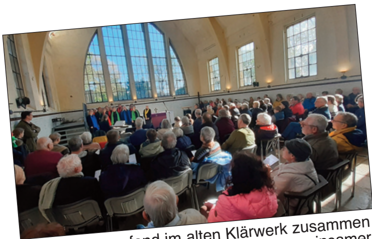
Am Palmsonntag fand im alten Klärwerk zusammen mit dem Gospelchor „Rhein Voices“ ein gemeinsamer Gottesdienst aller evangelischen Gemeinden Krefelds statt.